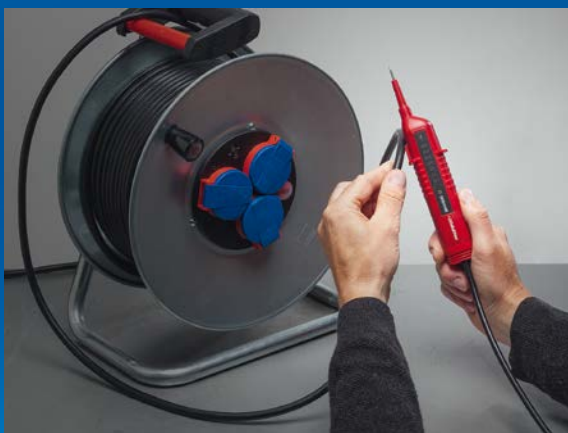
Lokalisierung von Kabelbrüchen