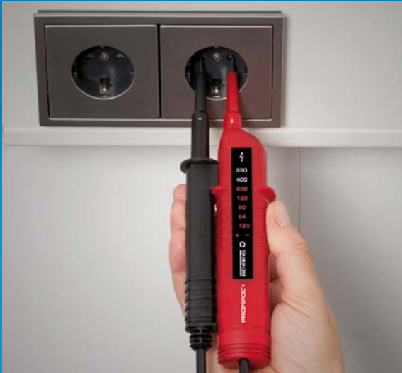
Einhandbedienung an Steckdosen