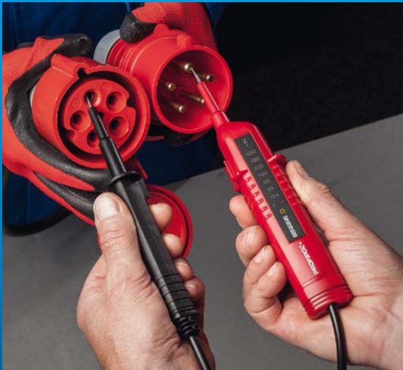
Durchgangsprüfung an Leitungen