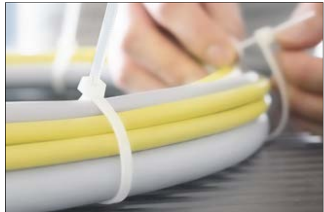
RELK Kabelbinder zur temporären Bündelung.