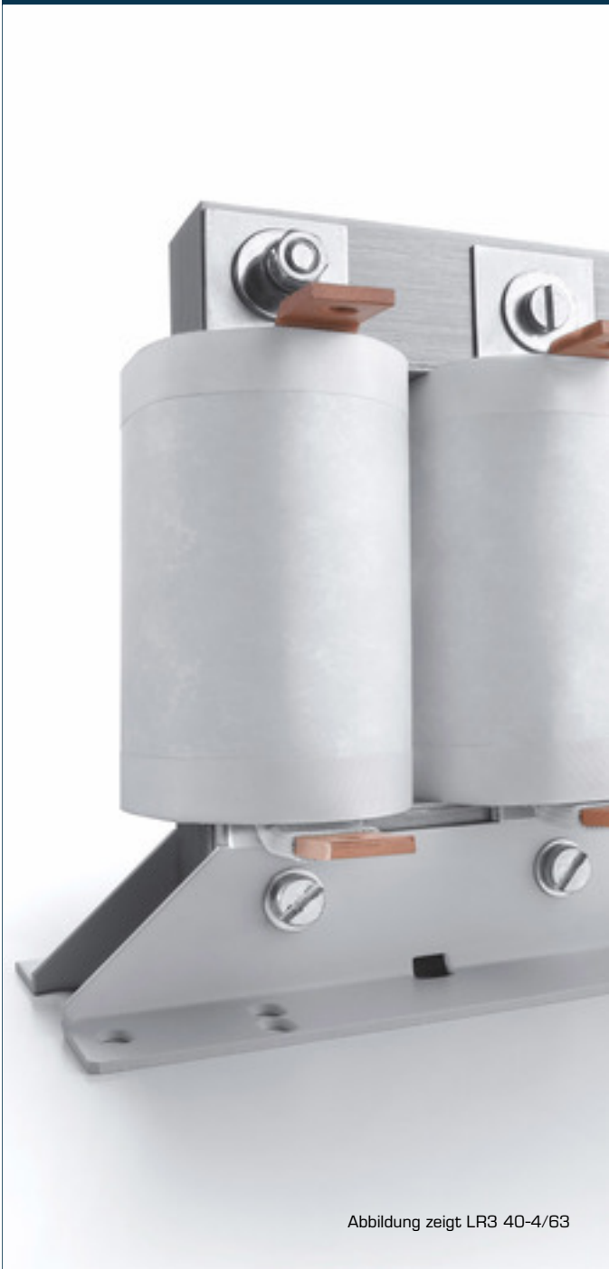
Abbildung zeigt LR3 40-4/63