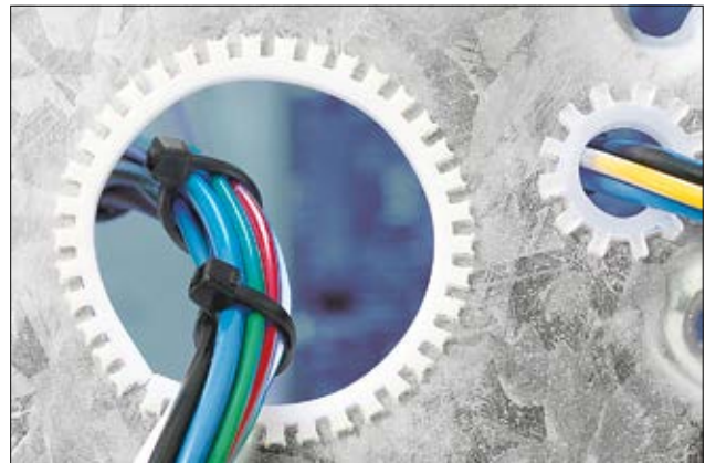
Optimaler Schutz von Kabeln und Leitungen an Blechkanten.