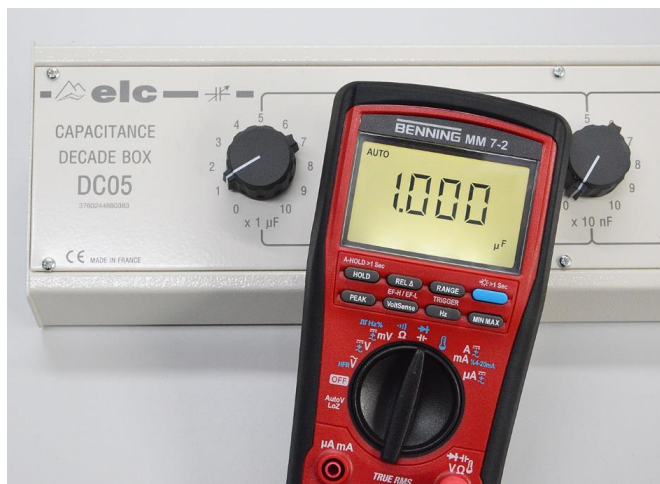
Kapazitätsmessbereich von 0.01 nF - 10 mF

Insgesamt betrachtet eignet sich das BENNING MM 7-2 sehr gut als universelles Diagnosewerkzeug, da es neben seiner umfangreichen Funktionalität auch jeweils breite Messbereiche bietet.