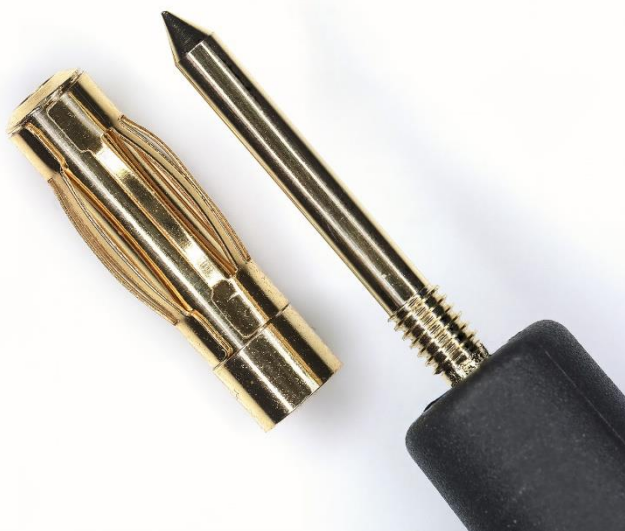
Hochwertige vergoldete Prüfspitzen für dauerhaft geringe Übergangswiderstände. Schraubbare 4 mm Büschelstecker.