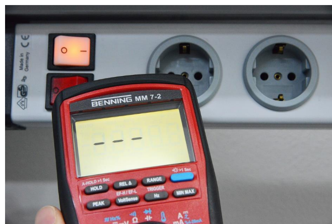
Berührungslose Spannungsdetektion. Hiermit können auch Leitungsunterbrechungen, beispielsweise an Verlängerungsleitungen, auf einfache Weise aufgespürt werden.

Zur berührungslosen Spannungsdetektion steht die VoltSensor-Funktion zur Verfügung. Im vorderen Bereich des Gehäuses ist ein Spannungsdetektor für elektrische Wechselfelder verbaut. Dieser wird über die Taste „VoltSense“ aktiviert. Durch nochmalige Tastenbetätigung kann dessen Empfindlichkeit ausgewählt werden. Zusätzlich signalisiert das MM 7-2 die Stärke des Spannungsfeldes akustisch und über ein vierstufiges, horizontales Balkendiagramm.