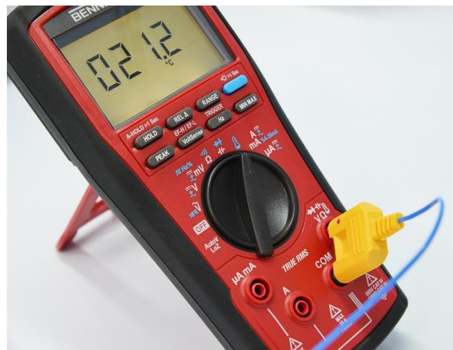
Temperaturmessung durch mitgeliefertem Thermodraht vom Typ K mit 0.1 °C Auflösung, Tischaufsteller ausgeklappt.

Im 600- \mu A-Messbereich erzielt das BENNING MM 7-2 eine Auflösung von 0,01 \mu A und ermöglicht hiermit die exakte Beurteilung auch geringer Gleichströme.