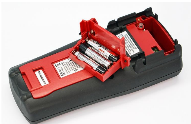
Praktische Lösung: Das herausnehmbare Batteriefach ermöglicht einen bequemen Tausch der Batterien.