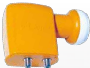
SPWB30 (747402) (Abbildung ähnlich)

Das Televes Wideband LNB SPWB30 besitzt 2 Ausgänge (vertikal & horizontal) an denen jeweils der komplette SAT Frequenzbereich (10,7-12,75 GHz) mit einer Oszillatorfrequenz von 10,41 GHz auf den Ausgangsfrequenzbereich von 290-2340 MHz umgesetzt wird. Das Wetterschutzgehäuse mit 40 mm Feeddurchmesser besitzt einen ausziehbaren Schutz für die Anschlüsse.