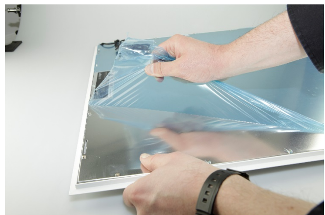
Abb. 3: Entfernen der Schutzfolie