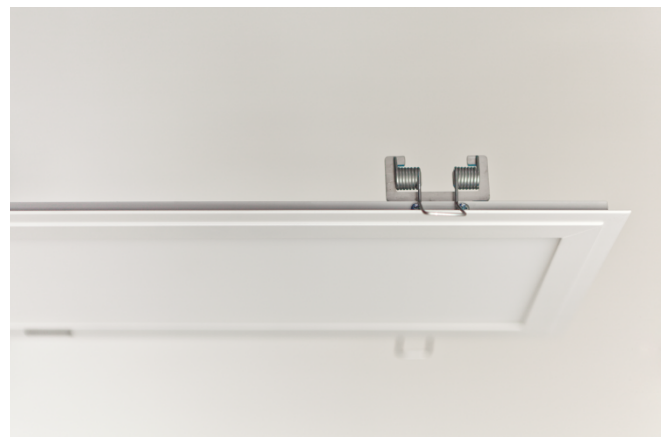
Abb. 1: LED Panel SNAP mit montiertem SNAP-IN Einbausatz

Das Panel SNAP 198x1218 ist standardmäßig mit weißem Rahmen erhältlich. Die Bauform des Rahmens ist auf alle gängigen GK-Montagearten abgestimmt, die verschiedenen Lichtfarben 3000 und 4000 Kelvin runden die Vielfalt ab. Das LED Panel SNAP fällt aufgrund des separaten LED Treibers und der Betriebsspannung von < 50 VDC nicht unter die Niederspannungsrichtlinie. Es erfüllt dennoch die einschlägigen Sicherheitsvorschriften, einschließlich der Vorschriften für photobiologische Sicherheit (Gefahrengruppe 0) und EMF-Vorschriften. In Verbindung mit einem abalight LED Treiber (s. Treibermatrix LED Panel SNAP) erfüllt das LED Panel SNAP 168x1218 die EMV-Richtlinie. Alle weiteren technischen Merkmale und Daten bezüglich des LED Panels SNAP 198x1218 wie kompatible Treiber und Zubehör sind dem Leuchten-Datenblatt zu entnehmen und nach Bauabschluss in der Baudokumentation zusammen mit dieser Installations- und Betriebsanleitung zu hinterlegen.