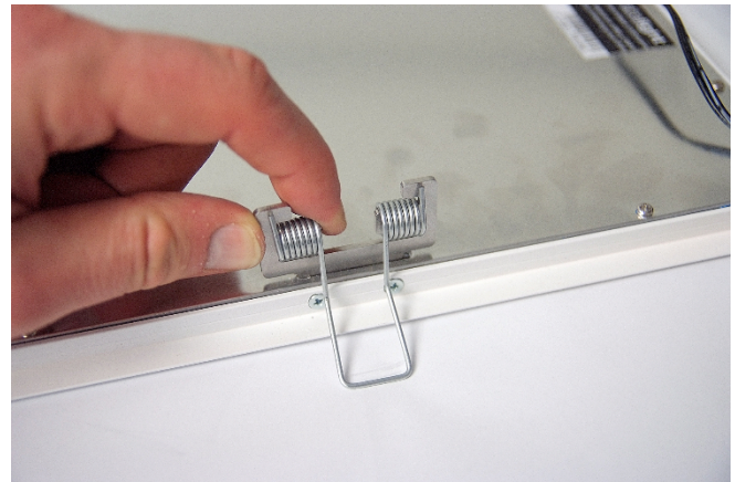
Abb. 4: SNAP-IN Federbügel

Bei Nichtbeachtung der Hinweise oder unsachgemäßer Bedienung wird für Folge-, Sach- und Personenschäden keine Haftung übernommen.