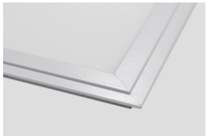
Abb. 2: LED Panel SNAP-Rahmen