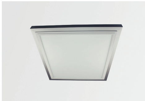
Aufbau-Montagerahmen für LED Panel SNAP, silber matt