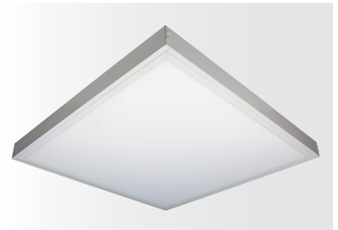
Multi-Rahmen für LED Panel SNAP, weiß