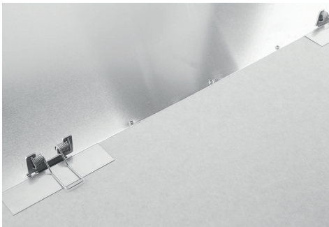
GK-Montage mit SNAP-IN Federeinbausatz