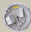
Notstrom-Modul zur Nachrüstung