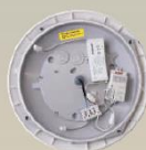
HF-Modul HF-Bewegungssensor zur Nachrüstung