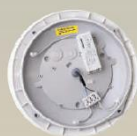
Standard-Modul MultiLumen-Treiber: dreistufig einstellbare Helligkeit (2000lm, 1500lm, 1000lm)

Gezielt Vorbeugen ist besser als ständiges Austauschen: Die LED-Feuchtraum- und Außenleuchten FONDA sind aus extrem robustem Kunststoff gefertigt (Schlagfestigkeitsklasse IK10). Dadurch widerstehen sie versehentlichen Beschädigungen oder bewussten Vandalismus-Angriffen. Typische Anwendungsgebiete sind Außenanlagen, Flure und Treppenhäuser, Sanitärräume sowie Gemeinschaftsunterkünfte. Der HF-Bewegungssensor kann nachgerüstet werden. Die Helligkeit kann auf 2.000 lm, 1.500 lm oder 1.000 lm eingestellt werden. Das schlagfeste Gehäuse ist weiß oder silber und hat optimierte seitliche Kabelzuführungen für die Aufputzinstallation.