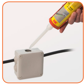
Neuer Scotchcast Easy Dispenser 250 für exakte Dosierung vom Harz