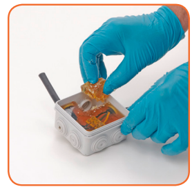
Weiches & flexibles Harz, einfach wiederentfernbar