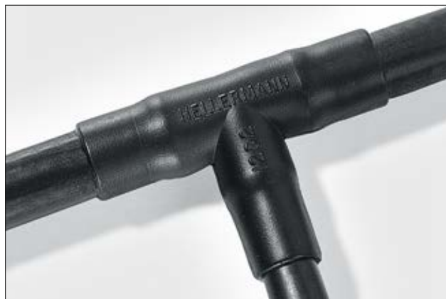
1202-1-G verarbeitet auf einer Abzweigstelle.

Weitere Informationen zu Material und Klebstoff auf Seite 274 und 275.