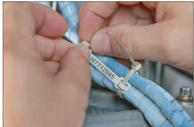
Kabelbinder mit Außenverzahnung und Kennzeichnungsschild HFTP48 aus PEEK.