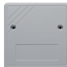
▲ KGTGH862 (X4271)