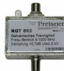
▲ KGT862 (X4270)