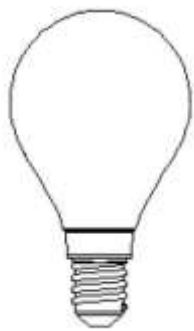
Abmessungsskizze LED LM85172-4

– http://www.lightme.eu/oekodesign/entsorgung/index.html