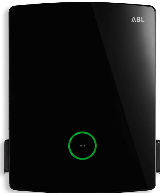
Référence du produit 100000002

Sa conception robuste et sa finition de qualité protègent la Wallbox eM4 Twin des agressions extérieures. Grâce à son équipement standard avec interrupteur différentiel de type A et contrôleur d'isolement à courant différentiel résiduel, la Wallbox est prête à brancher. Toutes les Wallbox d'ABL sont « Made in Germany » et offrent le plus haut niveau de sécurité.