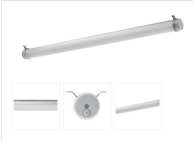
TUBIS N LED