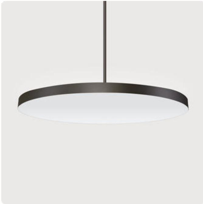
Abbildungen ggf. nur ähnlich, dienen als Orientierung.