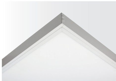
Multi-Rahmen für LED Panel VEKT, weiß