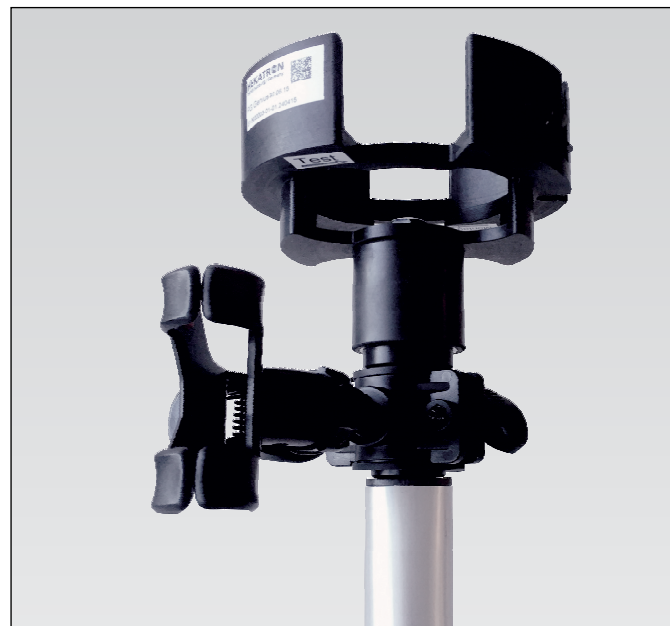
Abb. 01 Prüfgerät Genius mit Smartphone-Halterung