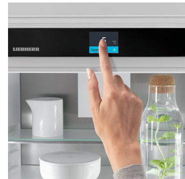
Touch & Swipe-Display

Freuen Sie sich über einen optimal ausgeleuchteten Innenraum: Die LightTower rücken Lebensmittel ins beste Licht und sie sind so positioniert, dass Ihr befüllter Kühlschrank stets großflächig ausgeleuchtet wird. Da die LightTower flächenbündig in die Seitenwände integriert sind, bleibt zudem mehr Platz für Ihre Lebensmittel.