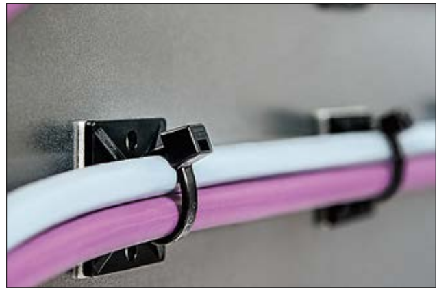
MB-Serie im quadratischen Design als schraubbare oder selbstklebende Version verfügbar.