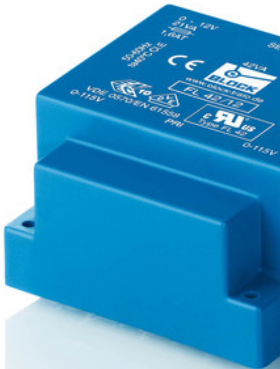
Abbildung zeigt FL 42/12