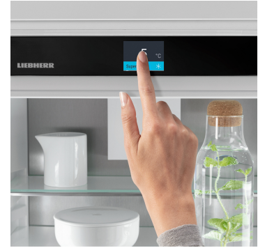
Touch & Swipe-Display

Die LED-Beleuchtung sorgt in Ihren BioFresh-Safes für ein angenehmes Licht. So finden Sie Ihre gewünschten Lebensmittel noch einfacher. Die energieeffiziente LED-Einheit ist elegant und platzsparend über den Safes positioniert.