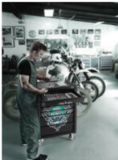
Exklusiver Werkstattwagen im Tool Rebel Design