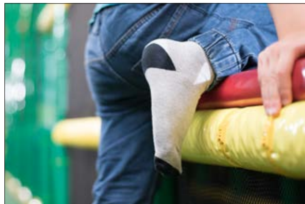
PE-Serie - Kabelbinder mit flacher Kopfgeometrie minimieren das Verletzungsrisiko und schonen gleichzeitig das Material.