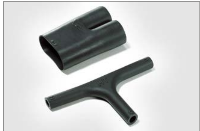
412H622-9 ungeschumpft und vollständig geschumpft.