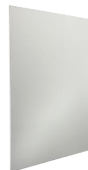
VL-Axxxxx in Weiß