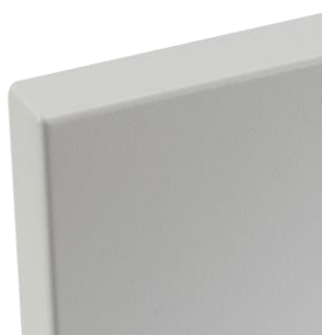
Detail der Ecke