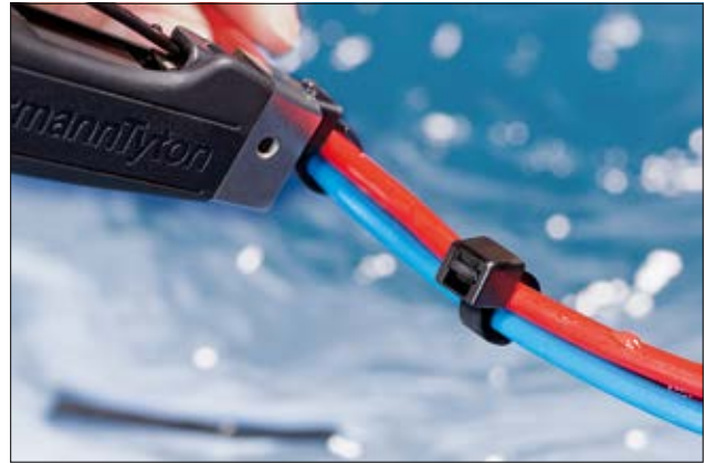
Polypropylen Kabelbinder für erhöhte chemische Anforderungen und Temperaturen bis +115 °C.